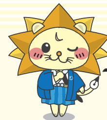
日本司法書士会連合会 公式キャラクター「しほ~しし」®